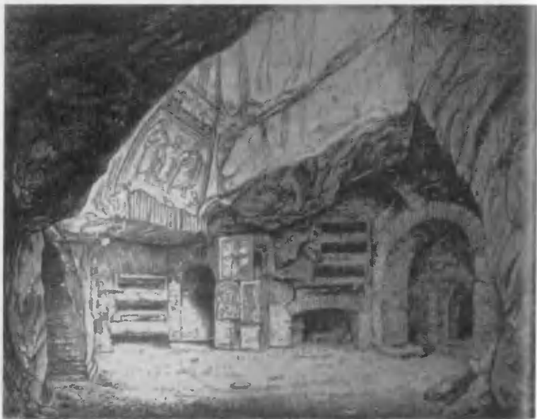
Крипта св. Цецилии в катакомбе св. Каллиста.