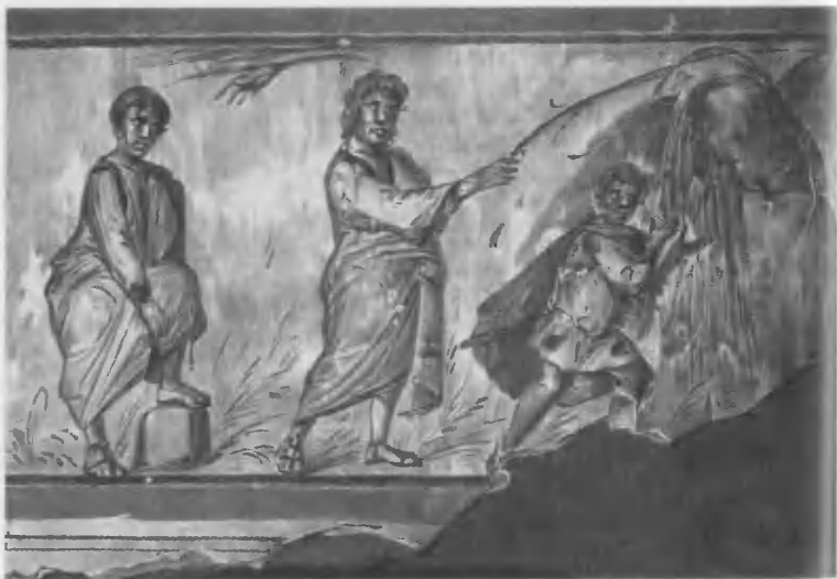
Пророк Моисей на горе Хорив. Катакомба св. Каллиста. Середина II в. Акварель Ф. П. Реймана. 1896.