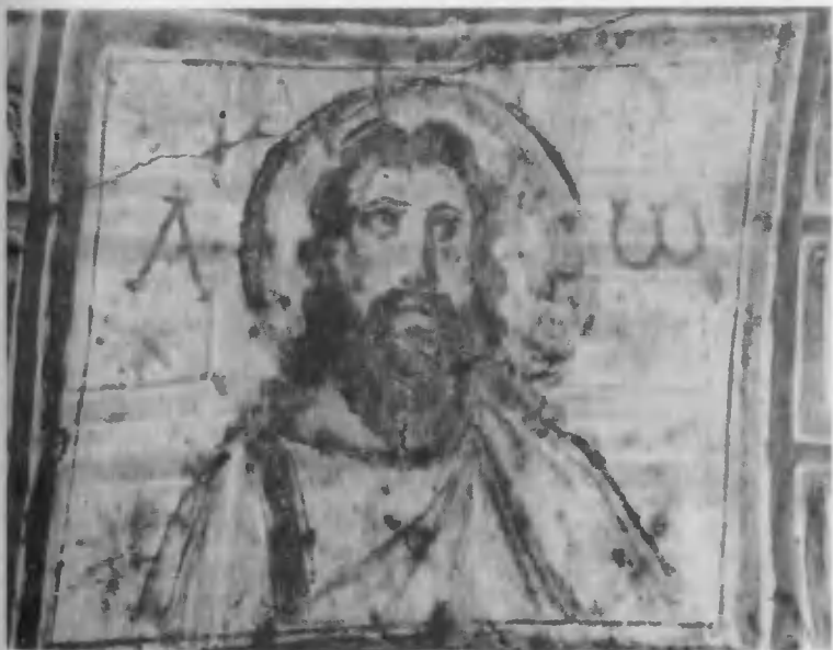
Одно из первых изображений Христа с бородой. Катакомба св. Комодиллы. Вторая половина IV в.