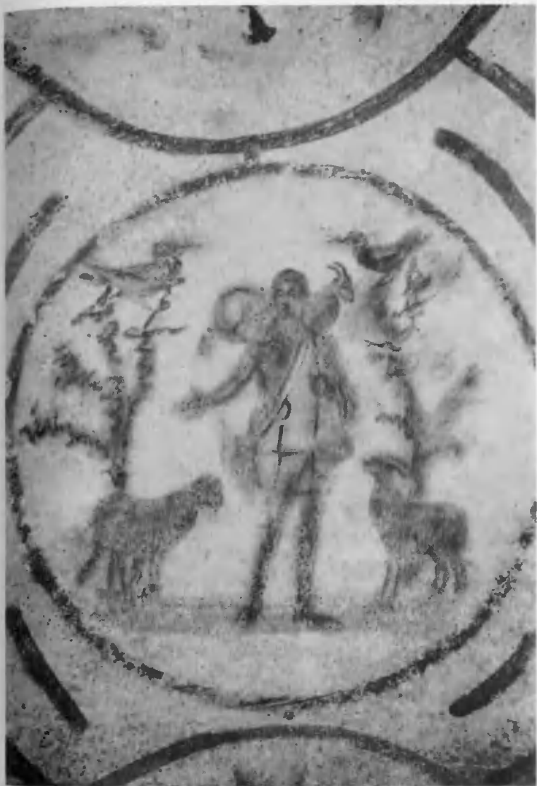
Добрый Пастырь. Катакомба св. Прискиллы. Середина III в.