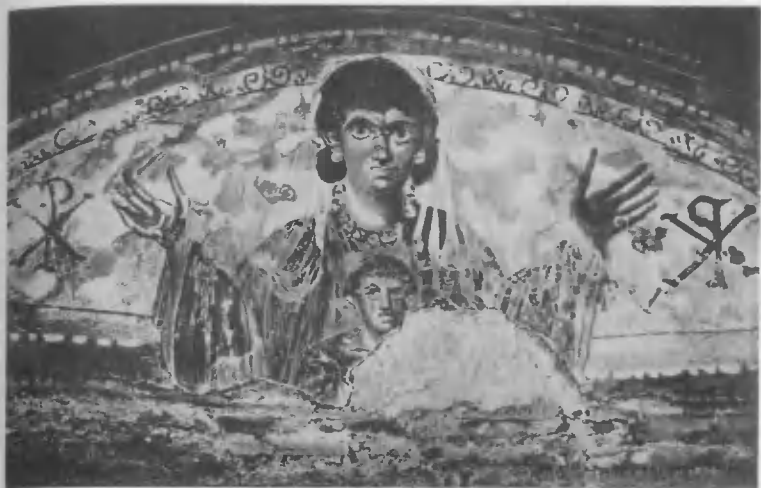
Божья Матерь и Христос. Середина IV в.

Якорь — символ креста и рыбы — символ Христа. Катакомба св. Прискиллы.