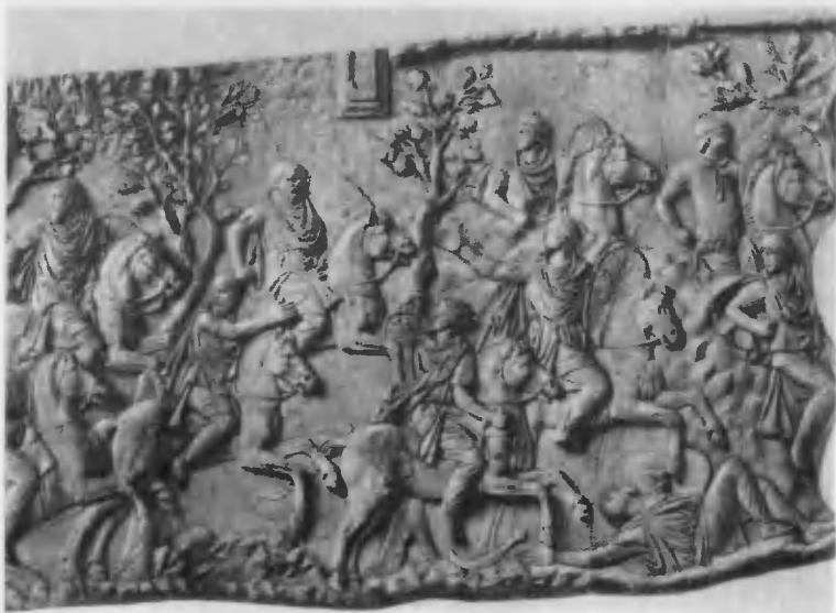
Рельеф колонны Траяна в Риме. Начало II в.