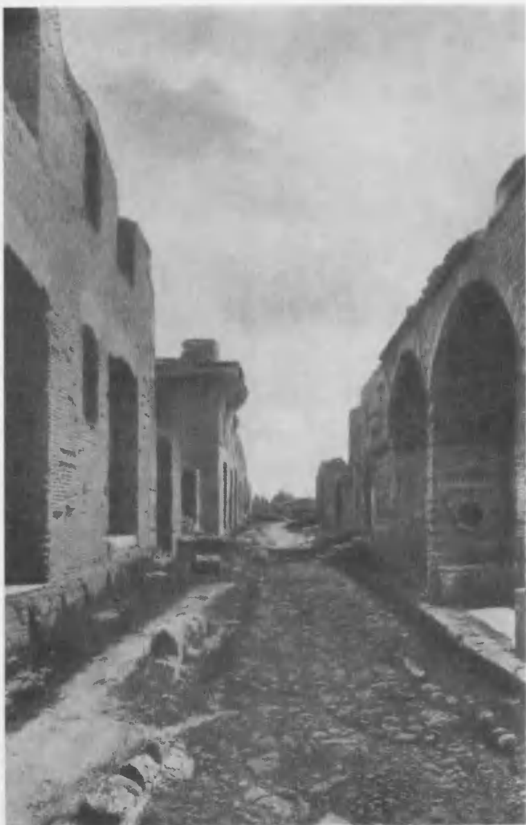
Улица в Остии, близ Рима. Постройки II—III вв.