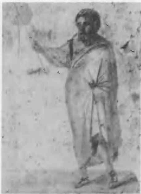
Три отрока в печи вавилонской. Катакомба св. Прискиллы. Первая половина III в. Фрагмент.