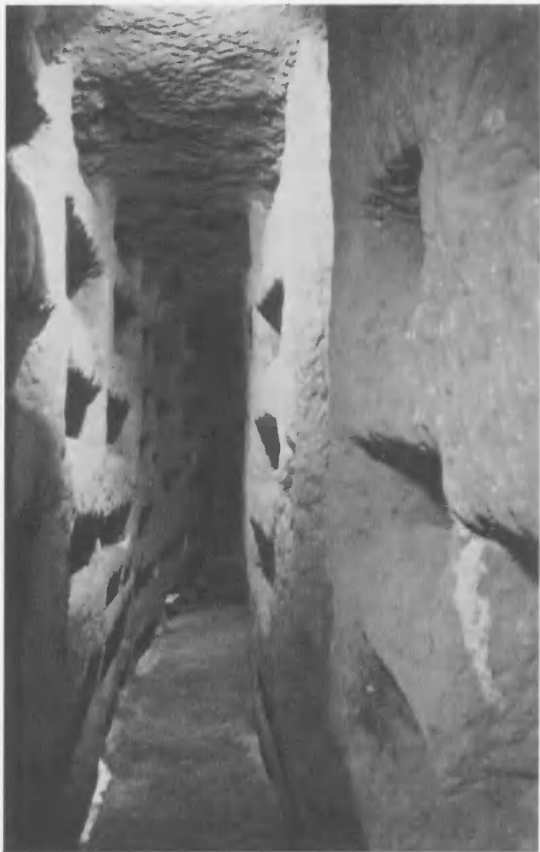
Мертвенные ложа в катакомбе св. Каллиста.