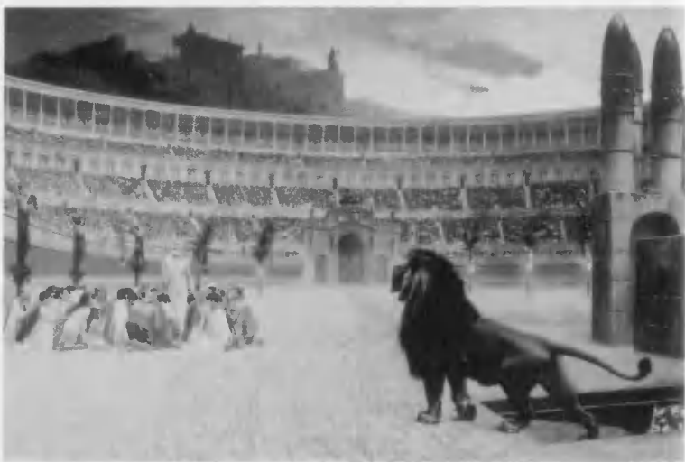
Жером Ж.-Л. Первые христиане.