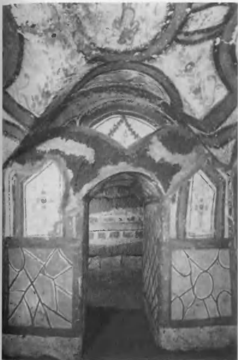
Погребальная комната в катакомбе св. Памфила.