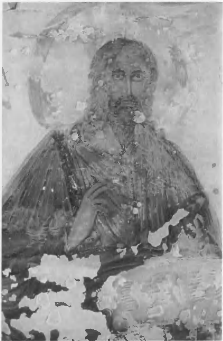
Христос на троне. Катакомбы св. Петра и Маркеллина. Конец IV в. Акварель Ф. П. Реймана. 1896.