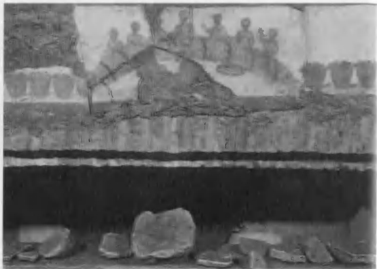
Изображение евхаристической трапезы («Вечеря семи гостей»). Катакомба св. Каллиста.