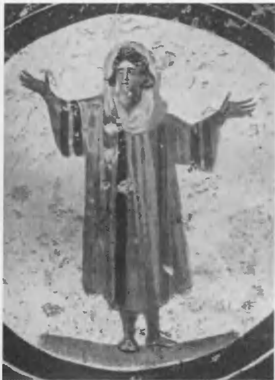
Божья Матерь Оранта. Катакомба св. Каллиста. Вторая половина III в.