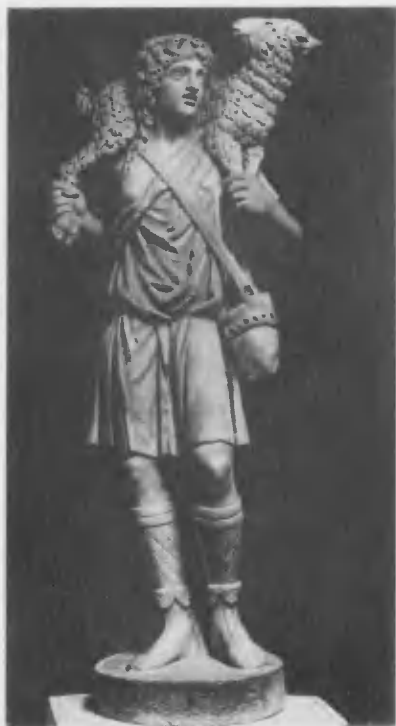
Добрый Пастырь. III в. Мрамор. Рим.