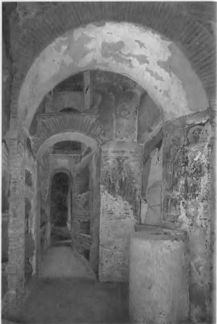
Вид крипты св. Корнелия. Катакомба св. Каллиста. III в. (Росписи — VII в.). Акварель Ф. П. Реймана. 1897.